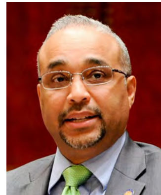
JOSE R. PERALTA NY State Senator

Con la participación de/ With the participation of